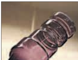
NESTEN FERDIG: Når Beate Einen har pusset og stelt sylindren, skal den bli innerskjerm i en eksklusiv, munnblåst lampe-kuppel.

Nyhetsleder kultur Guro Istad tlf. 55 21 45 72 – epost: kultur@bt.no