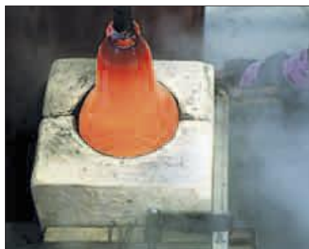
FORM: Det glødende glasset formes i en gipsform som Beate Einen har bygget selv.

Drømmen er å jobbe sammen med en god industridesigner og lage gjenstander som kan settes i serieproduksjon.