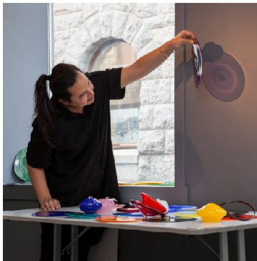
Kiyoshi Yamamoto (no)

Zdeňka gir døde trestammer nytt liv som skulpturer i glass. Under hennes opphold i S12 jobbet hun i en møysommelig prosess som inkluderte bruk av glass fra et gammelt drivhus, og silikon som formgivende materiale. Barklignende skall ble skapt med utgangspunkt i formen til døde trestammer hentet fra Krohnegården på Laksevåg. Skulpturene ble vist som en del av årets Young & Loving.