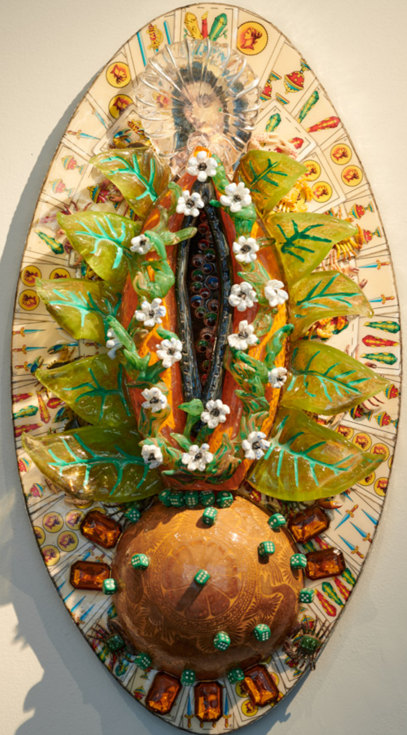
Einar and Jaimex de la Torre, AiR i S12 Retrospektiv.